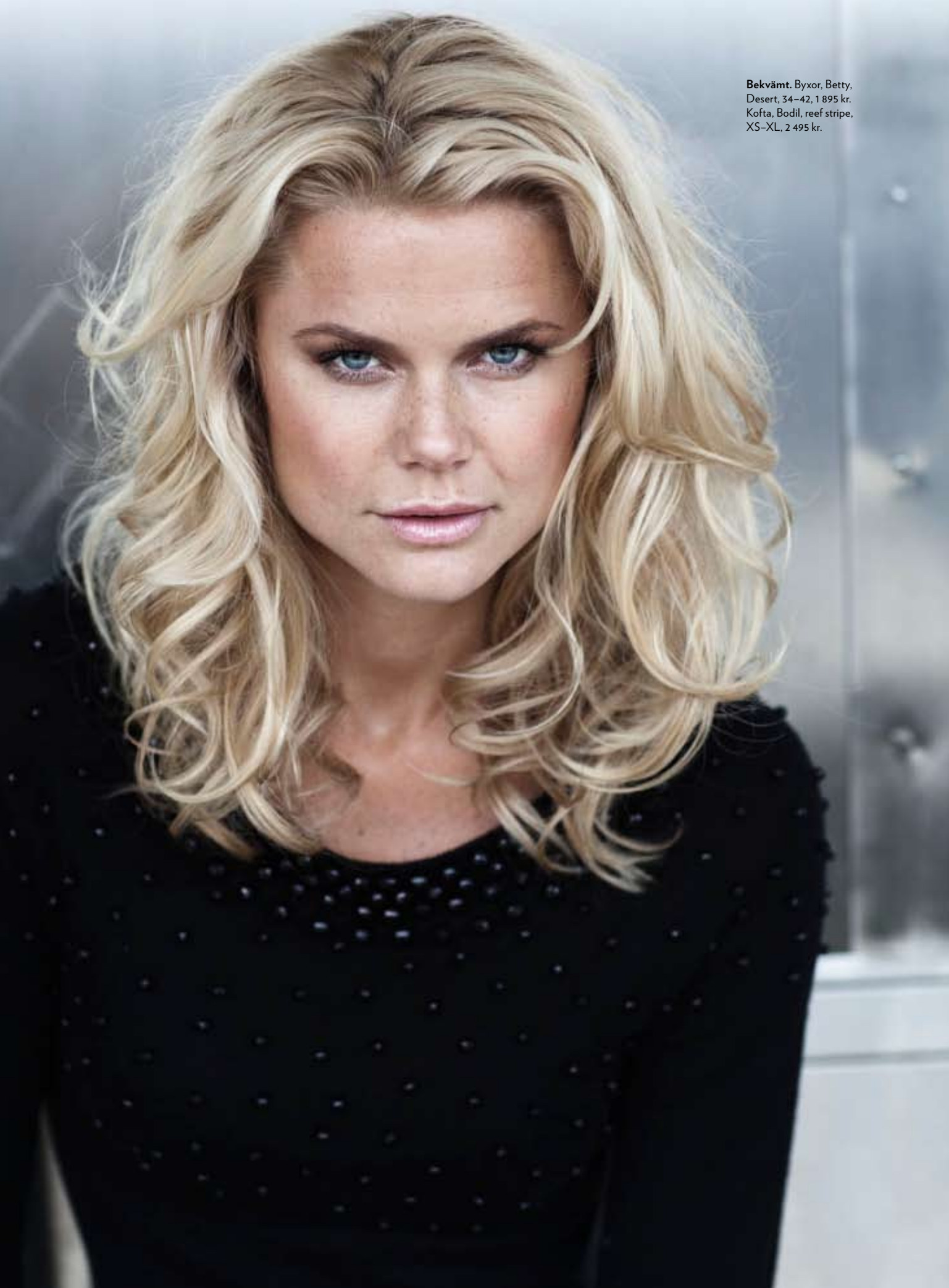
Bekvämt. Byxor, Betty, Desert, 34-42, 1 895 kr. Kofta, Bodil, reef stripe, XS-XL, 2 495 kr.