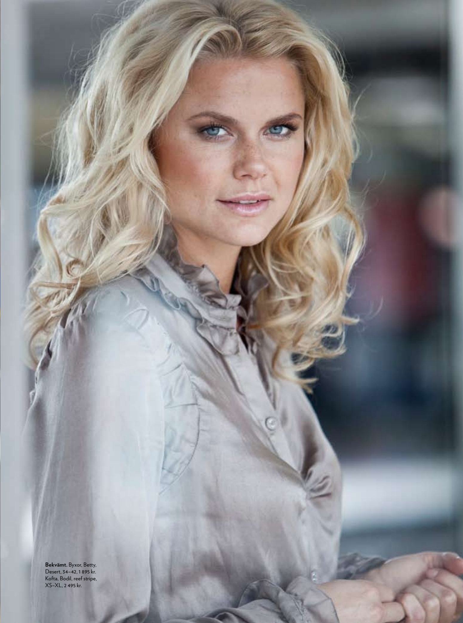
Bekvämt. Byxor, Betty, Desert, 34-42, 1 895 kr. Kofta, Bodil, reef stripe, XS-XL, 2 495 kr.