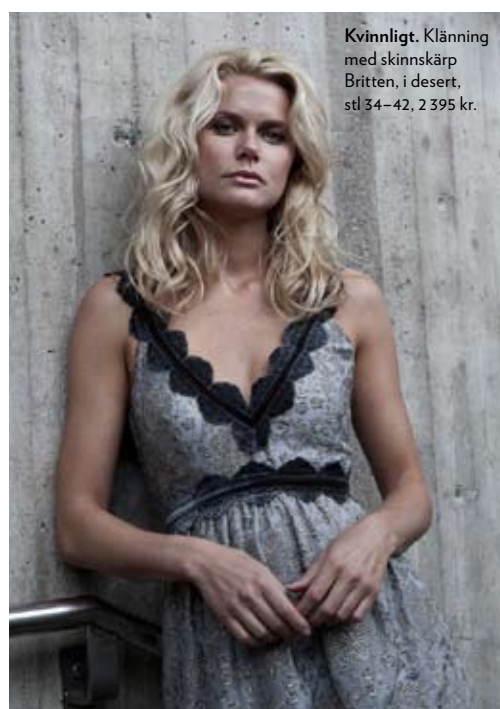
Kvinnligt. Klänning med skinnskärp Britten, i desert, stl 34-42, 2 395 kr.